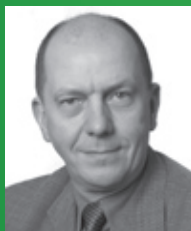
Reinhold Dellmann Minister für Infrastruktur und Raumordnung des Landes Brandenburg