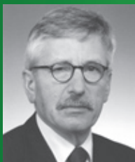
Dr. Thilo Sarrazin Senator für Finanzen des Landes Berlin